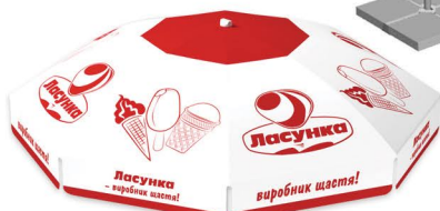
Зонт 1,8х1,8 м