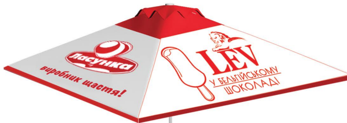
Зонт 3,5х3,5 м