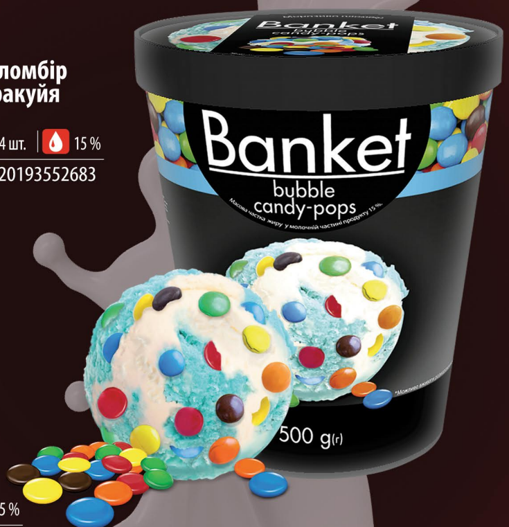
«Banket» bubble candy-pops 500 г | 4 шт. | 15 % штрих-код 4820193552560