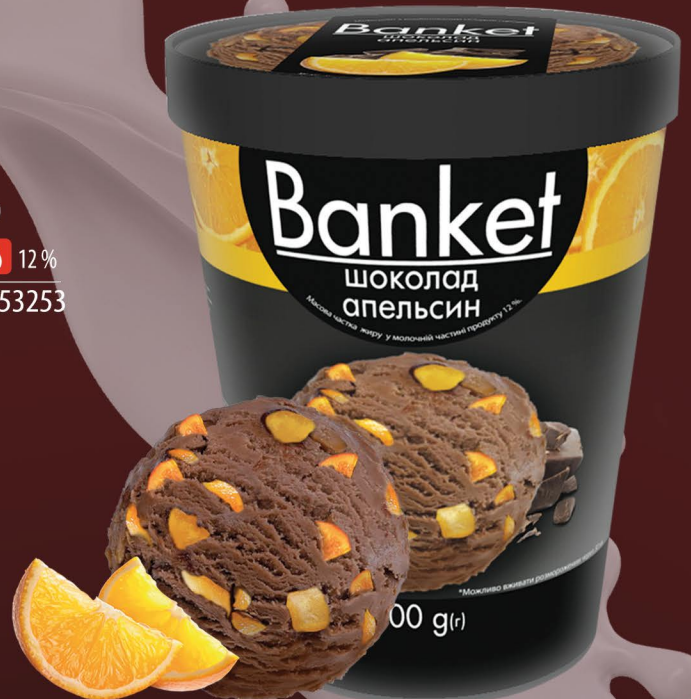
«Banket» шоколад-апельсин 500 г | 4 шт. | 12 % штрих-код 4820193552645