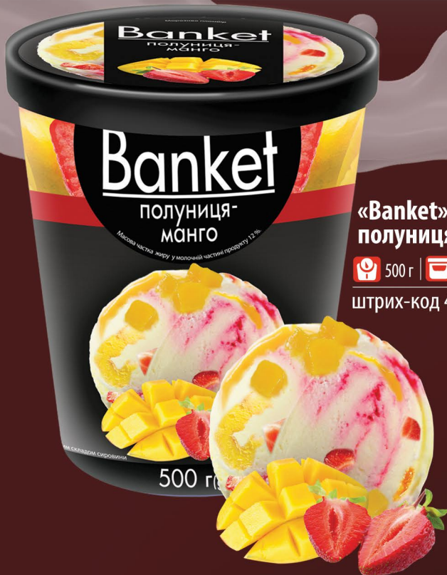
«Banket» полуниця-манго 500 г | 4 шт. | 12 % штрих-код 4820193553253