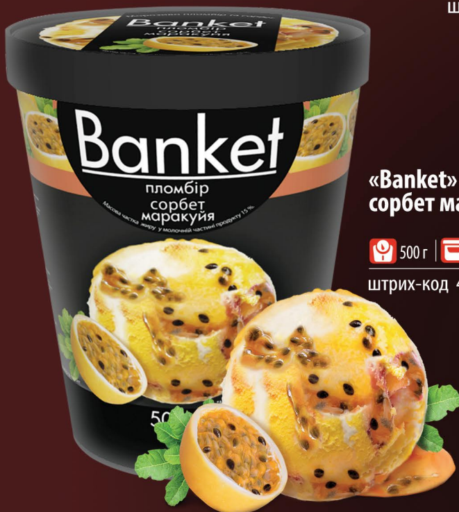
«Banket» пломбір сорбет маракуйя 500 г | 4 шт. | 15 % штрих-код 4820193552683